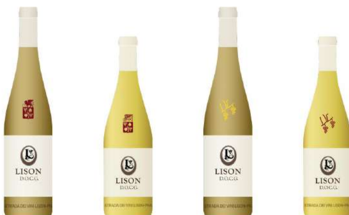
Immagini delle bottiglie di progetto, personalizzate, "LISON DOCG"

E' anche un "anello di visitazione" ( con circa 205 km di lunghezza dell'anello principale, a cui si sommano 88 Km di un anello secondario, per complessivi circa 293 Km) che si pone quale possibile risposta anche all'overtourism di Venezia, promuovendo la delocalizzazione dei flussi turistici e un modo nuovo di conoscere la Città e la Laguna di Venezia, insieme ai "territori veneziani".