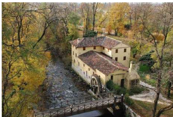
Mulino di Belfiore - Pramaggiore

I LUOGHI lungo la Strada dei Vini Lison-Pramaggiore