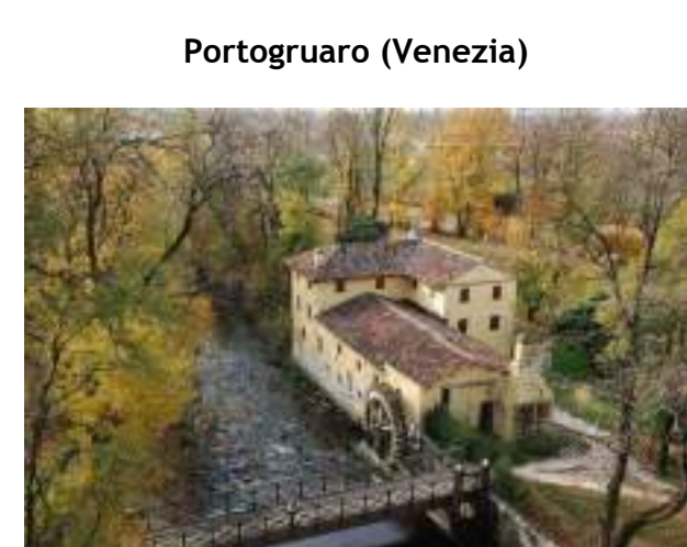
Mulino di Belfiore - Pramaggiore L'UOGN lungo la Strada dei Vini Lison - Pramaggiore