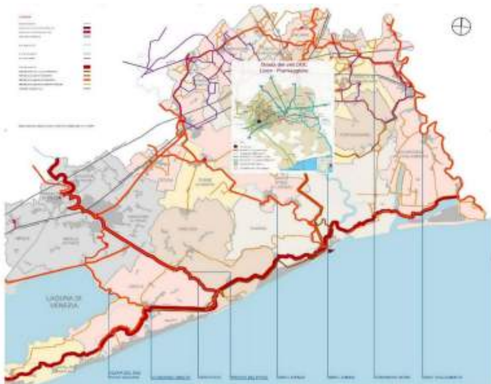
PLANIMETRA DEI PERCORSI TURISTICI NELLA VENEZIA ORIENTALE IN RELAZIONE ALLA STRADA DEL VINI

VENETIAN WINE ROAD Lison - Pramaggiore D.O.C. D.O.C.G. Italy