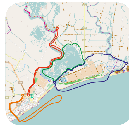
* "Itinerari del pescaturismo in ambiente marino e lagunare in Comune di Caorle" / Fishing Tourism Itineraries in the marine environment and lagoon of the city of Caorle *itinerari proposti dai pescatori di Caorle / itineraries suggested by fishermen of Caorle