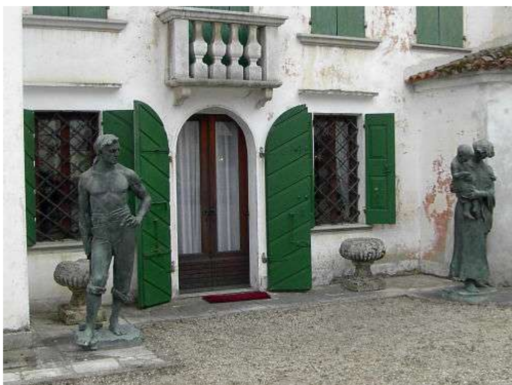
Figura 25: Villa Bombarda, particolare - Portovecchio di Portogruaro