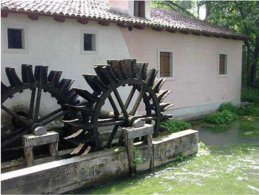
Figura 6: mulino di Boldara