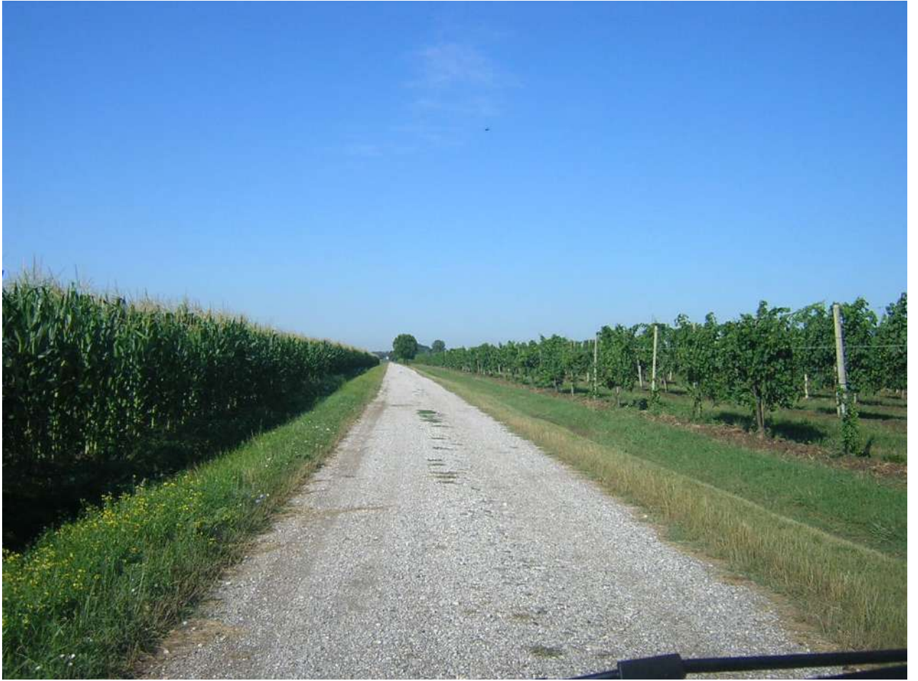
Figura 11: il paesaggio agricolo in prossimità del bosco di Bandiziol