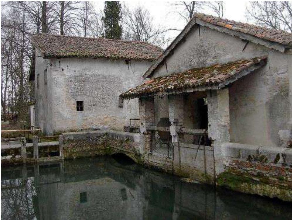
Figura 4: mulino di Villa Bombarda - Portovecchio