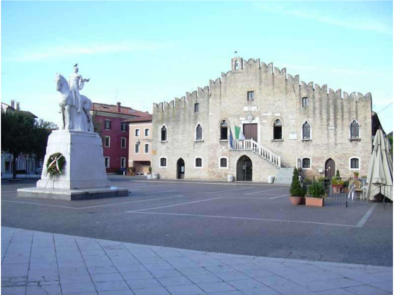
Figura 26: Portogruaro, Piazza Repubblica