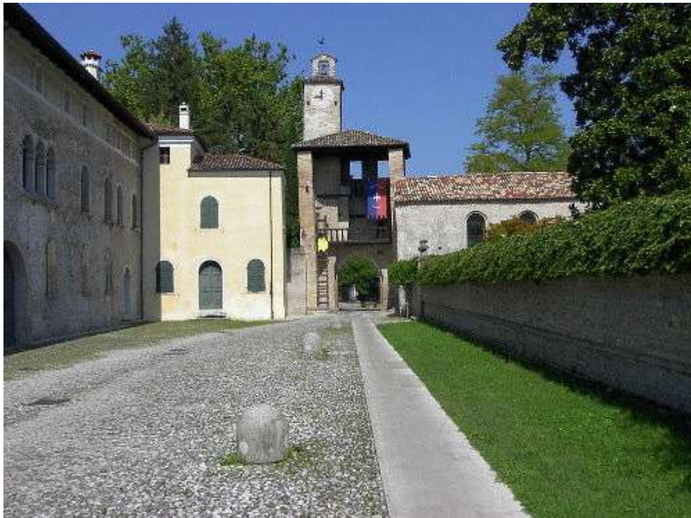
Figura 20: castello di Cordovado