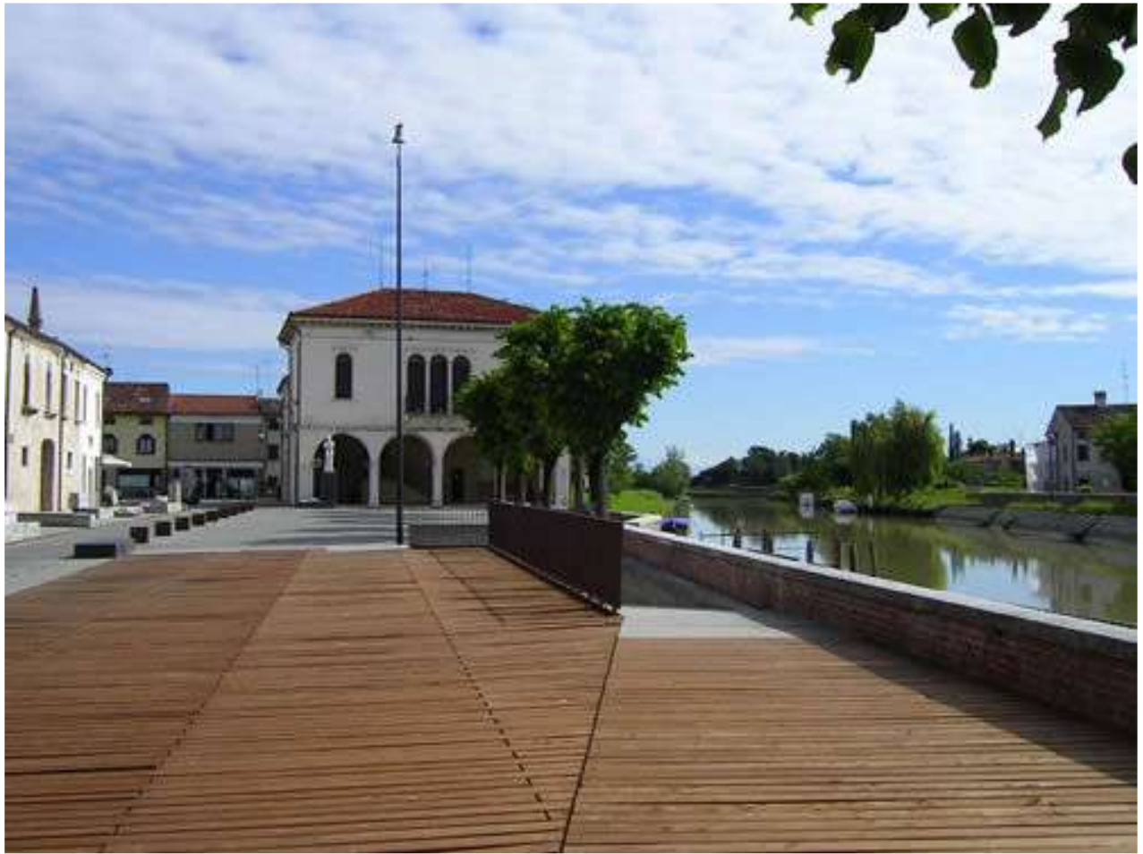
Figura 31: Concordia S., il Municipio