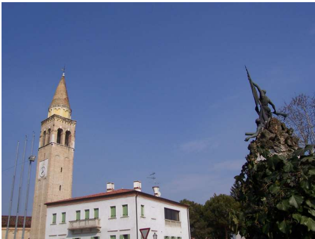
Figura 16: Corbolone - S. Stino