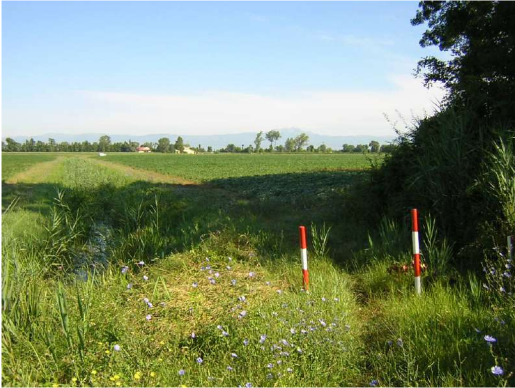
Figura 12: ingresso al Bosco di Bandiziol