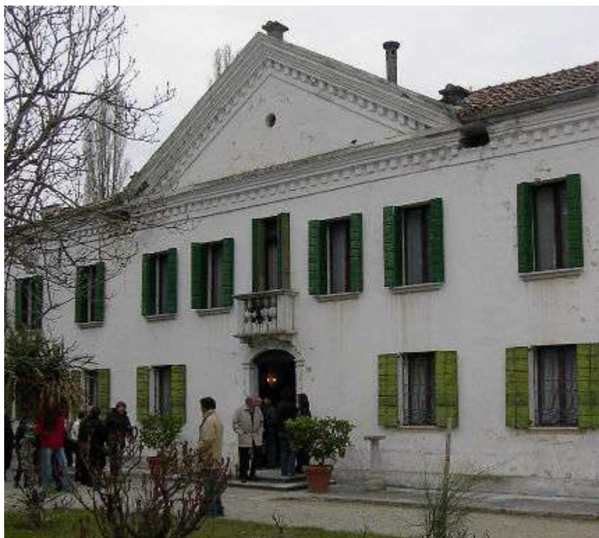
Figura 24: Villa Bombarda – Portovecchio di Portogruaro