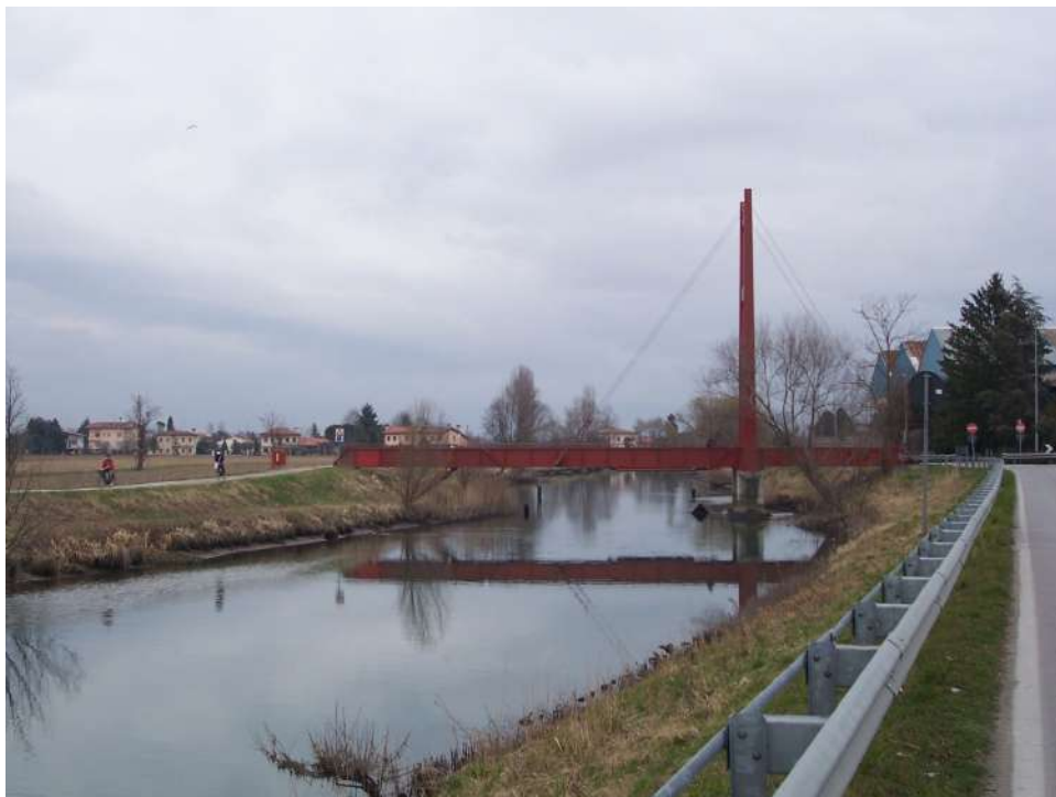
Figura 29: passerella di collegamento tra Portogruaro e Concordia S.