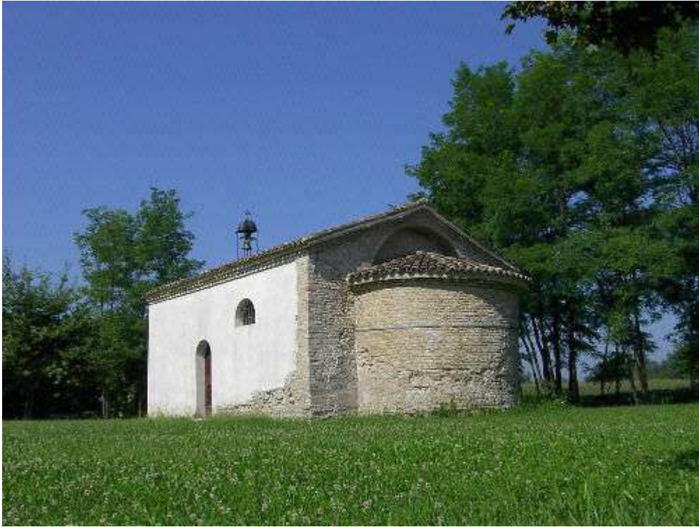
Figura 22: Bagnarola