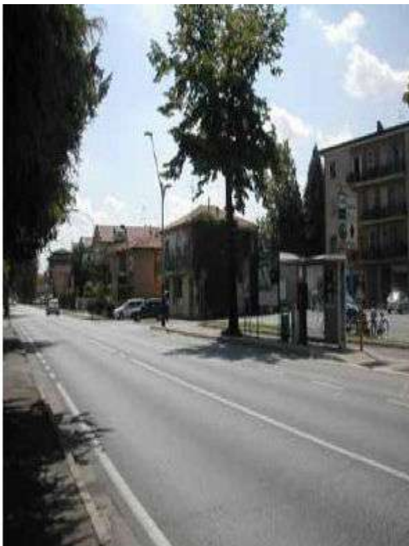
Figura 18: S. Stino, tratto in progetto dal centro verso la SS. 14