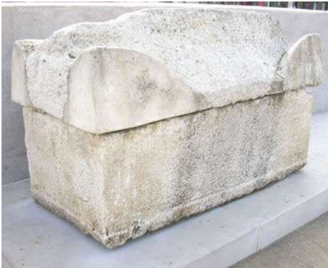
Figura 30: Concordia S., sarcofago di età romana