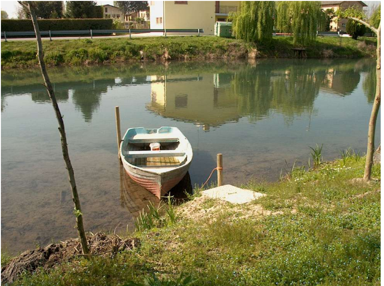
Figura 2: Portovecchio

in Portovecchio, il mulino de “La Sega” (Cinto C.), i mulini di Belfiore (Pramaggiore), i mulini di Stalis e Bagnarola (Gruaro e Sesto al R.)