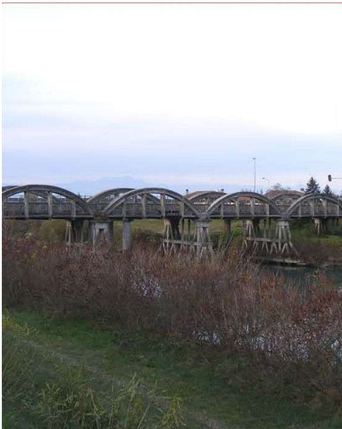
Figura 19: "ponte degli archi" , S. Stino di L.