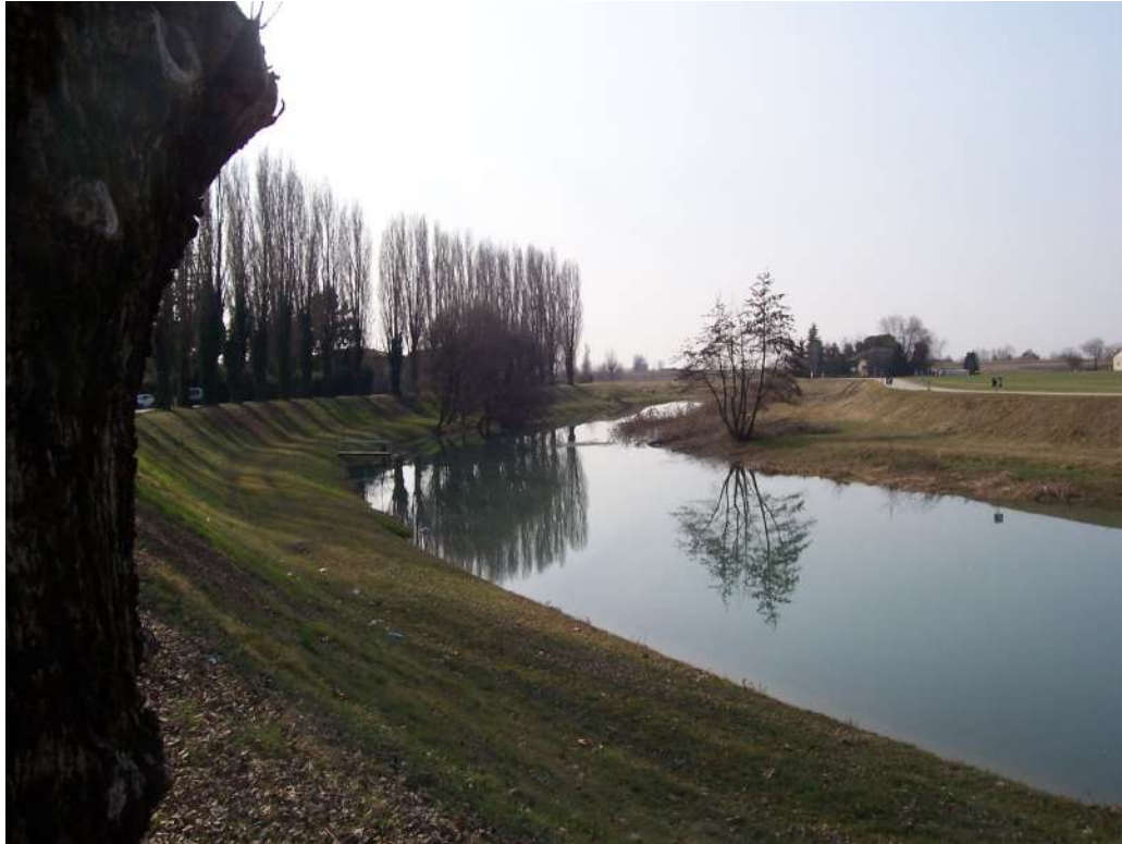
Figura 15: riviera di Corbolone - S. Stino di L.