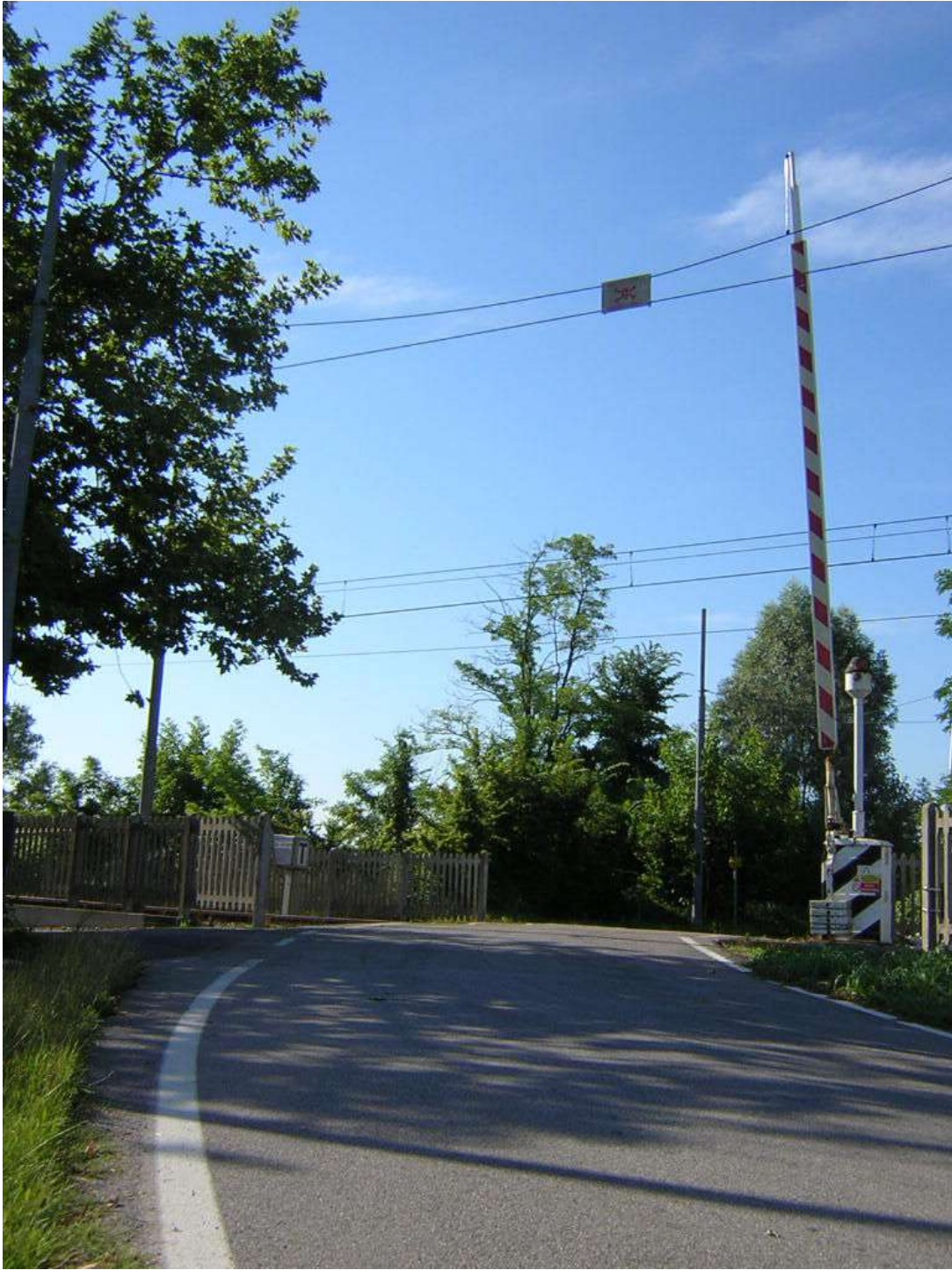
Figura 8: passaggio a livello sulla "strada dei vini"