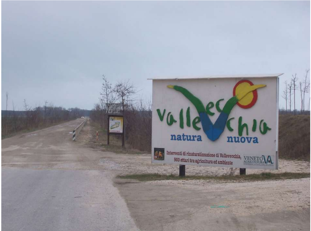
Figura 33: Ingresso all'area naturalistica di Valle Vecchia - Caorle