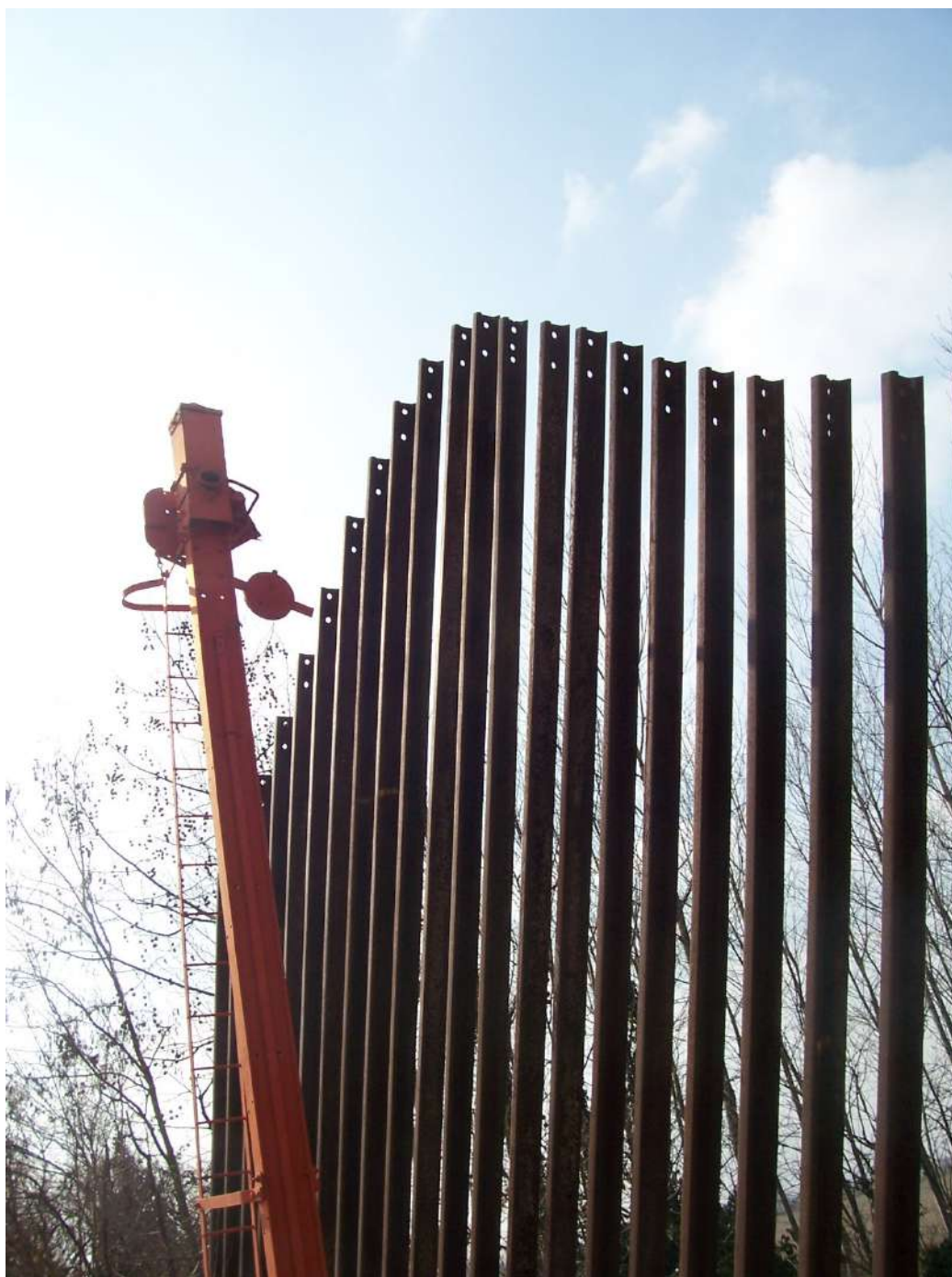
Figura 7: monumento sulla pista ciclabile di Annone V.