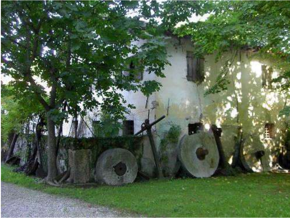
Figura 5: mulino di Villa Bombarda