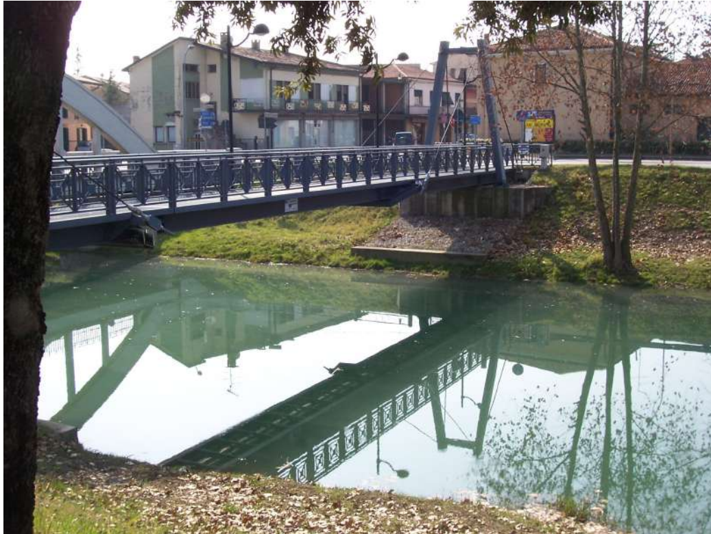
Figura 17: passerella ciclabile sul Malgher, centro di S. Stino di L.