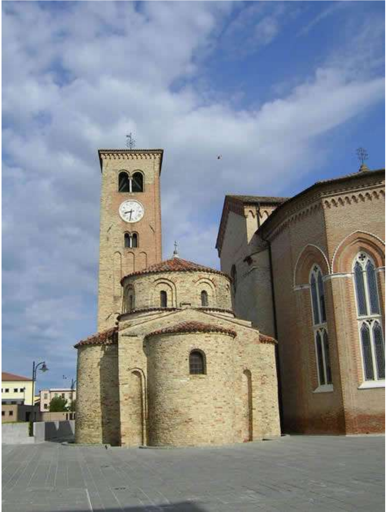
Figura 32: Concordia S. , il battistero