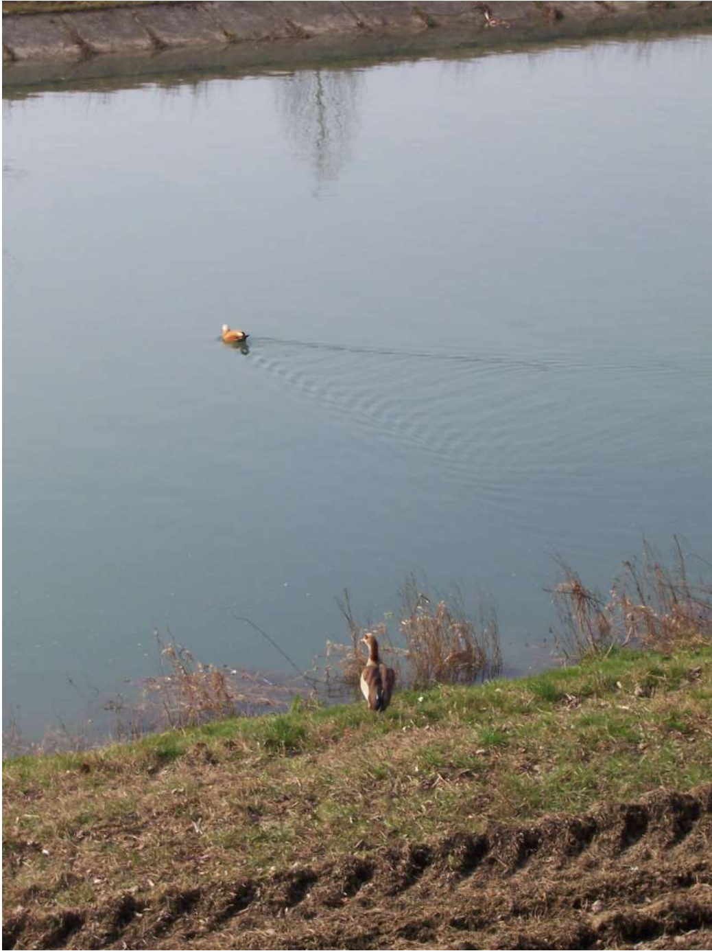
Figura 14: riviera di Corbolone