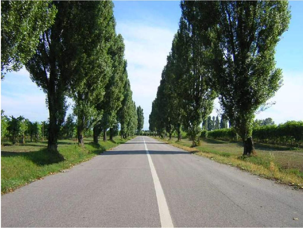
Figura 9: la strada dei vini tra Annone V. ed il Bosco di Bandiziol