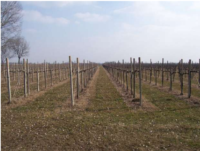
Figura 10: vigne lungo il percorso