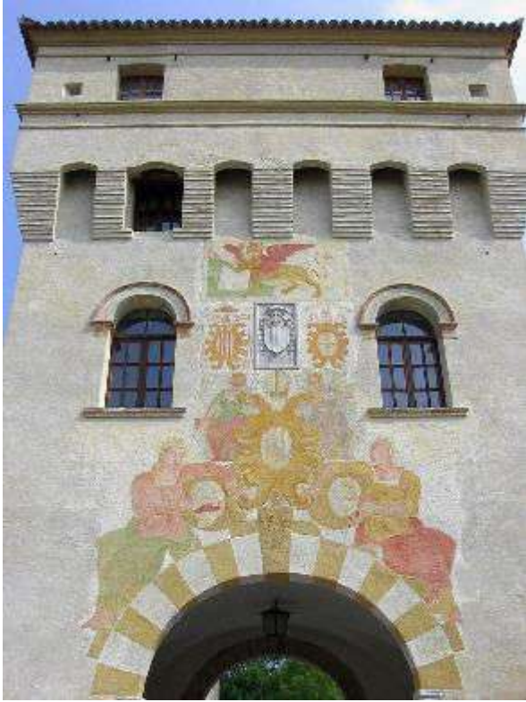
Figura 21: Sesto al Reghena