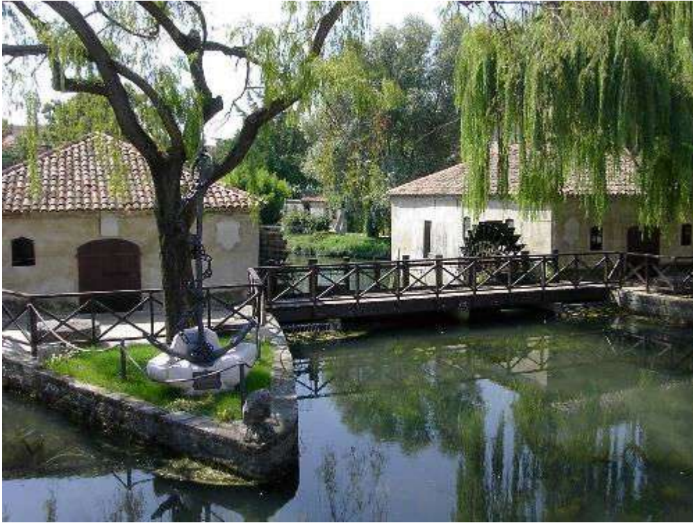
Figura 3: mulini di S. Andrea - Portogruaro