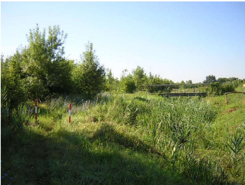
Figura 13: percorso ciclabile esistente nel Bosco di Bandiziol