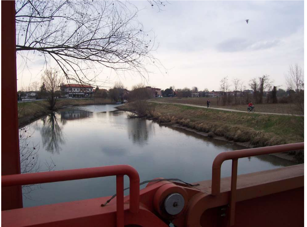
Figura 28: passerella ciclabile a Concordia Sagittaria