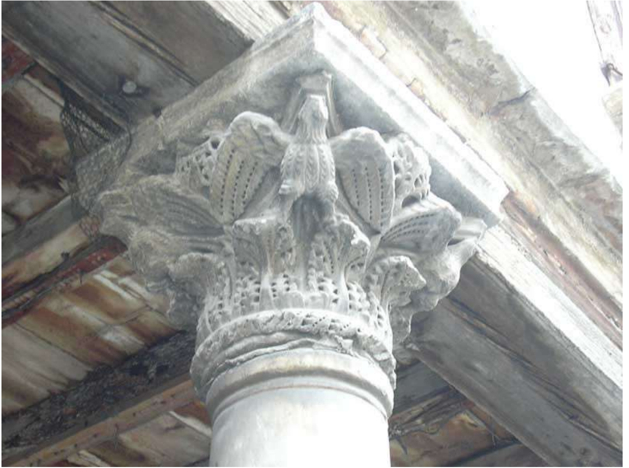
Figura 27: centro storico di Portogruaro, particolare di capitello